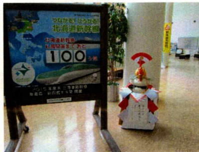
(1階道民ホールにて展示)