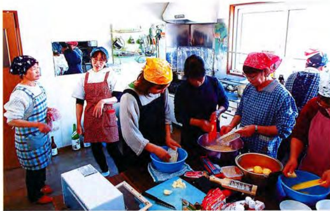
時短レシピ交換会（調理風景）