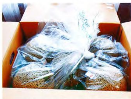
MAフィルム貯蔵メロン

写真は、10月26日に収穫し12月7日までの42日間貯蔵した果実の、糖度、熟度、食味などを確認した時の様子です。長期貯蔵における冬期間出荷が可能になると期待されています。