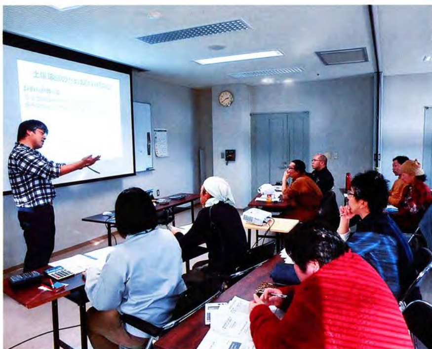
土壤診断に基づく施肥設計について学んでいます

令和元年度は、野菜、醸造用ぶどうの2コースを開講し、農業技術の習得を支援する予定です。