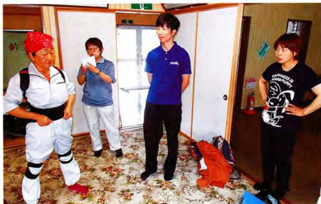
アシストスーツ試着会

普及センターは今後も女性農業者のニーズに応え、「楽しく」「ためになる」活動のサポートを続けていきます。