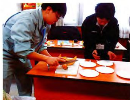
メロン品質の確認

平成29年度より道総研花・野菜技術センターによる、MAフィルムを使ったメロンの保存試験が始まりました。