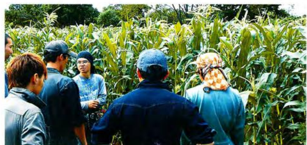
ポップコーンの生育状況を確認 （京極町4Hクラブ）

全道では惜しくも北海道代表には選ばれませんでしたでしたが、全道の取組に触れる良い経験となりました。