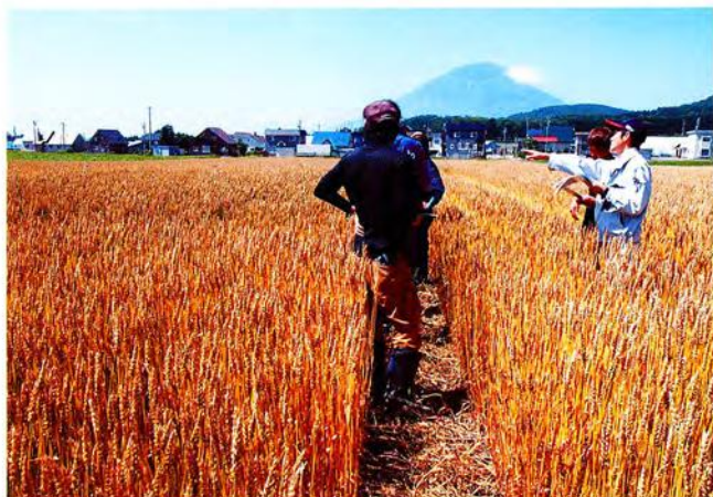
夏期の現地研修会

今後も普及センターは、若手農業者とともに将来を見据えたスキルアップを行っていきます。