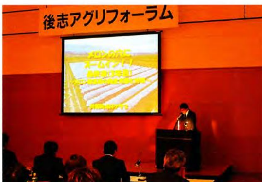
後志アグリフォーラムで発表を行う青年 （共和町4Hクラブ）

平成30年度後志アグリフォーラムのプロジェクト発表部門で、共和町4Hクラブの「メロンの穴にズームイン!!最終章～メロン障害果発生実態と対策～」が最優秀賞、京極町4Hクラブの「挑む～この地に実れ!!新戦力～」が優秀賞を受賞しました。両クラブは、北海道青年農業者会議で後志代表として発表を行いました。