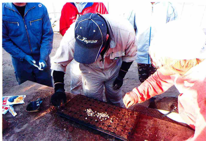
写真3 72穴セルへの種作業