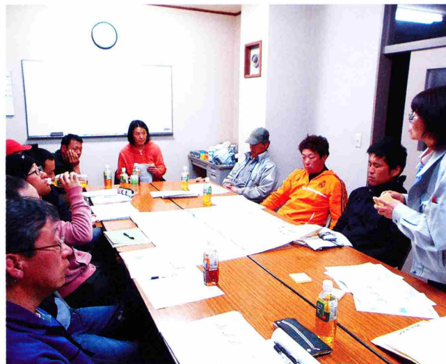
▲地域の将来について多くの提案がありました

去る4月18日(水)に地域の若手農業者10名が集まり、「赤井川村の将来を考える若手懇談会」を開催しました。懇談会では、最初に普及センターから今後15年間の地域農家戸数の変動予測を示し問題提起を行いました。