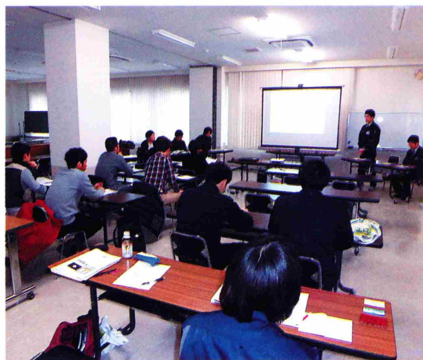
写真2 農薬と肥料の基礎を学ぶ