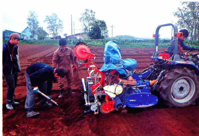
写真4 プロジェクトほ場づくり