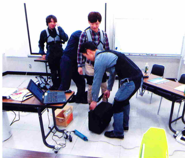
写真1 アシストスーツを試着する青年

本年は、72穴セルトレーで簡易育苗を行い、加工かぼちゃの収量向上を目指したプロジェクト活動を実施しています(写真3、写真4)。