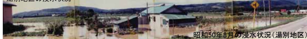
昭和50年8月の浸水状況(湯別地区)