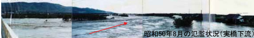
昭和50年8月の氾濫状況(実橋下流)