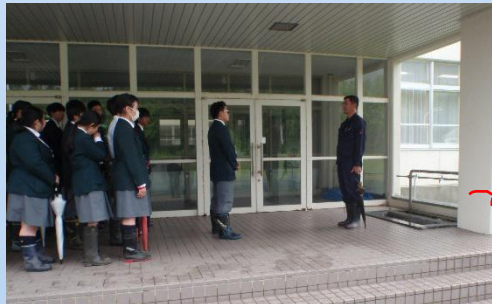
まずは高校生の代表から挨拶。

そのほかにも倶知安町、京極町に水が届いています。 そして今回は倶知安農業高等学校の3年生が見学に参加しました。