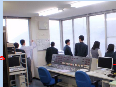
あいにくの天気なので窓から見学。。