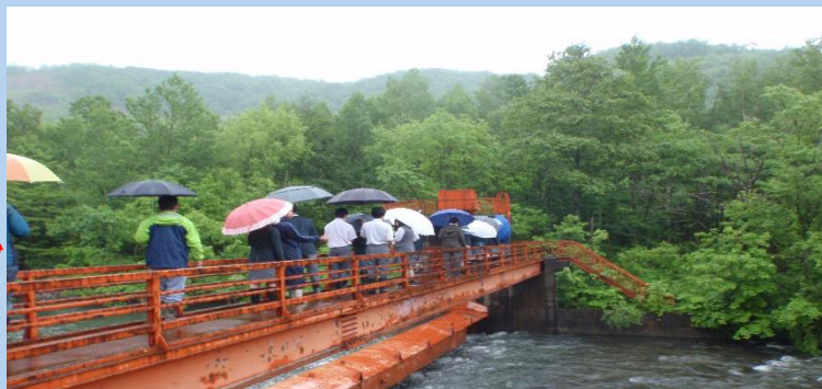
次は頭首工を見学。実際に上って説明を聞きます。