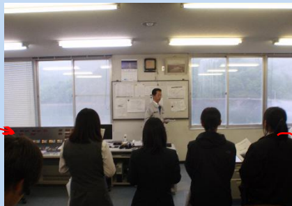
管理塔で説明を聞きます。