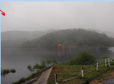
赤いところで水を取っています！