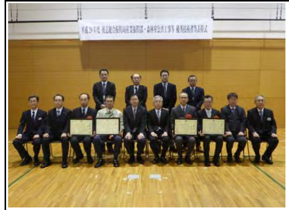
委託部門優秀技術者の表彰