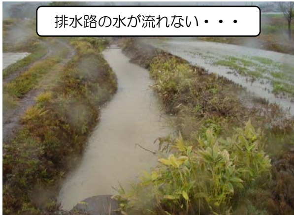
排水路の水が流れない・・・

排水路が整備されていないと、水が流れなくなり、水路から水があふれたり、隣の田んぼや畑が乾かなくなります。せっかく入れた暗渠排水からの水も抜けないから、作物の育ちが悪くなります(XoX)