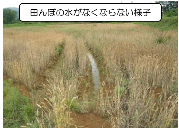
田んぼの水がなくならない様子