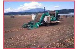
高収益作物の導入（タマネギの収穫）