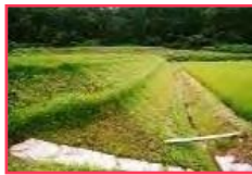
カバープランツ・小段