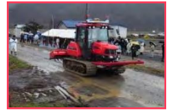
現場での講習・研修会