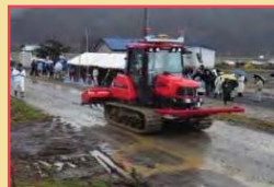
現場での講習・研修会