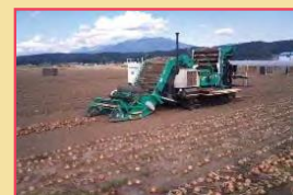
高収益作物の導入 (タマネギの収穫)

※ 高収益作物とは、地方自治体の農業振興計画等において位置づけられた振興すべき農産物や、地域のブランド認証制度で位置づけられた農産物など（主食用米、麦・大豆などの戦略作物助成の対象作物は除く。）。