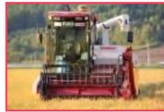
先進的省力化技術導入