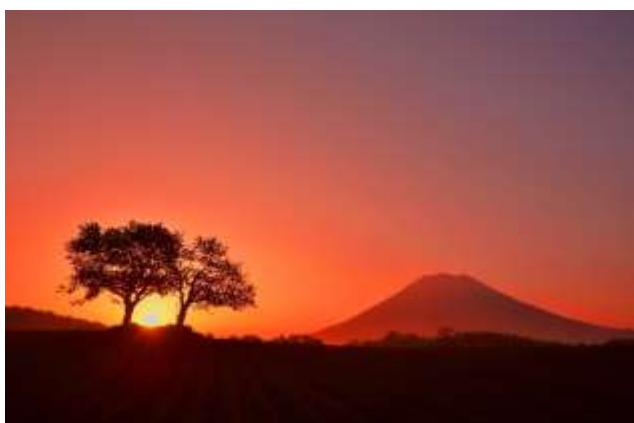
秋の羊蹄山(ニセコ町内より撮影)