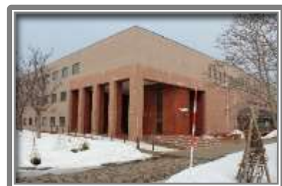
余市町中央公民館