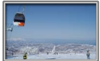
キロロリゾート(ゲレンデ)