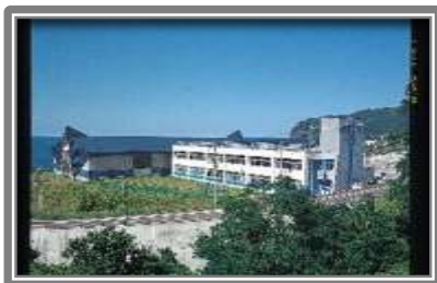
泊村アイスセンターとまりリンク