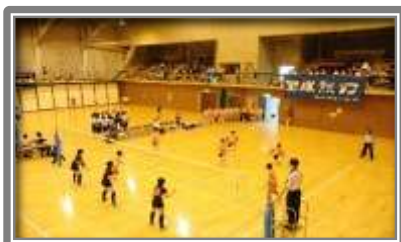
ニセコ町総合体育館