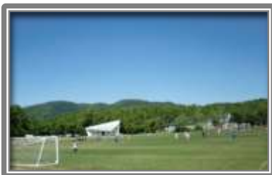
都運動公園サッカー場