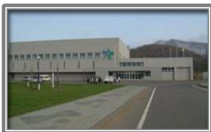
蘭越町総合体育館