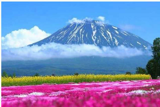
春の羊蹄山(倶知安町内より撮影)