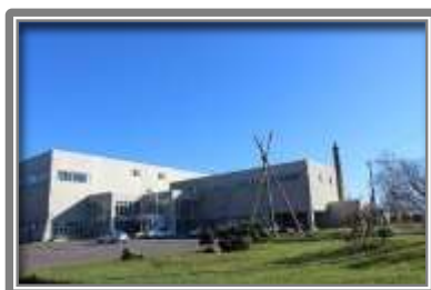
余市町総合体育館