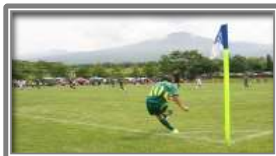
サッカー・ラグビー場