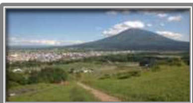
旭ヶ丘公園からの景色