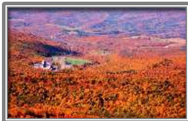
キロロリゾート全景(秋)