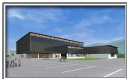
総合体育館(完成予想図)