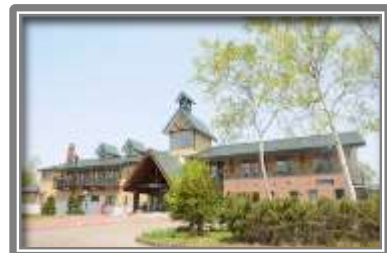
歌才自然の家(宿泊施設)