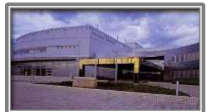
岩内地方文化センター