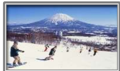
ニセコビレッジスキーリゾート