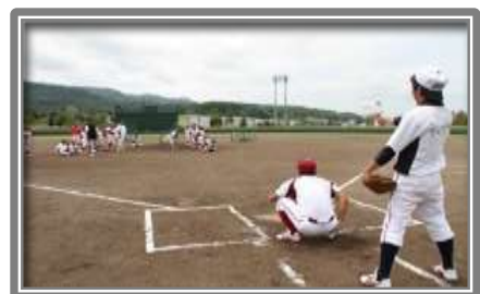
蘭越町総合運動公園野球場