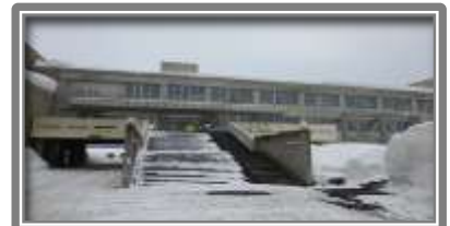
文化福祉センター