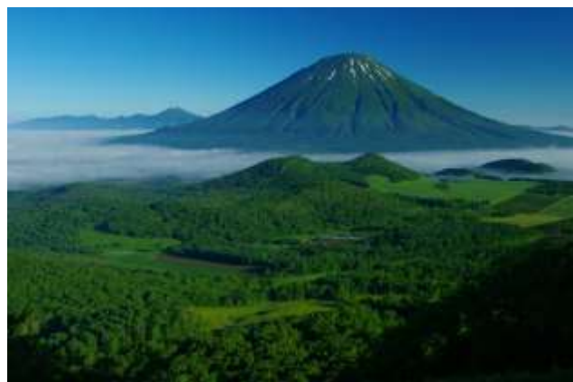
夏の羊蹄山(留寿都村内より撮影)