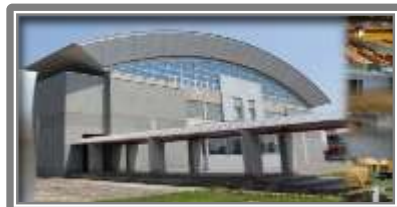
倶知安総合体育館