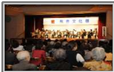
総合町民センター