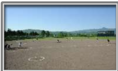
ニセコ町運動公園