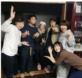
（シェアハウスでのお別れ会の様子）

1人1つずつの部屋が与えられていたため、慣れないシェアハウス生活でしたが、あまりストレスを感じることなく過ごすことができました。