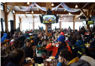
賑やかなHanazonoリゾートの中

職場の雰囲気は良かったです。スタッフは全員、毎日楽しみながら働いている感じで、皆さん笑顔で仕事していました。インターン先の Hanazono リゾートはいつも賑やかで、いるだけでワクワクする場所です。