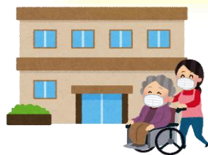
高齢者施設など に行くとき