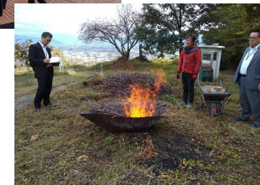
先進地視察（山梨県）

国内外のワイナリーにおけるカーボンニュートラルの取組に関する調査を実施し、管内ワイナリーに情報提供を行うことで、その取組実施を促し、しりべしワインのさらなるブランド力向上に資する。