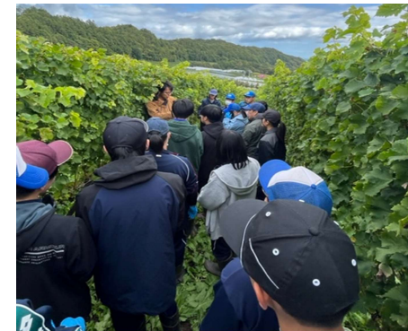
高校生向け就業体験