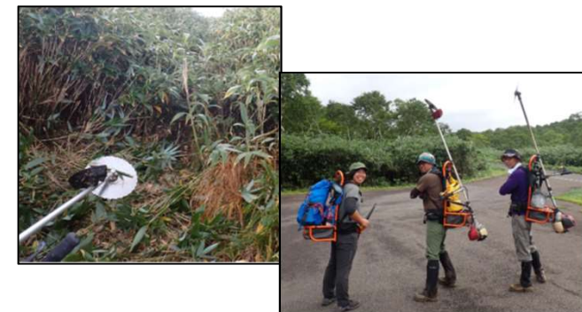
トレイル維持管理作業の様子