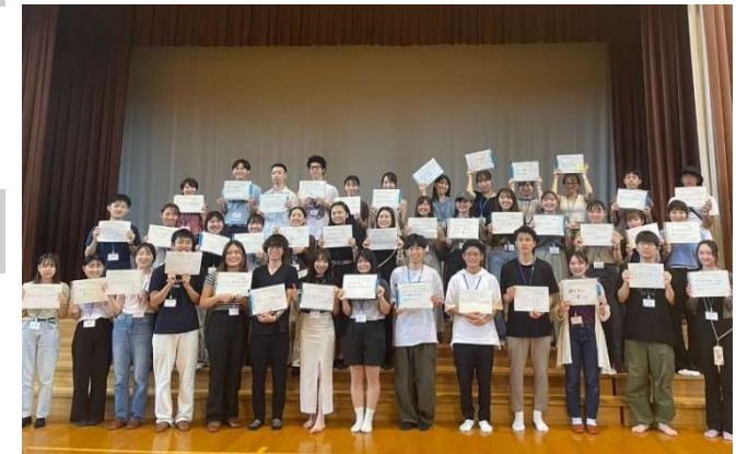
令和5年度ShiriBeshiグローバルインターンシップサマープログラム事前研修での参加者集合写真

上記研修のほか、参加者が主体的に多文化共生に関して学ぶことができるよう、外国人向け日本語サロンや地元高校との交流会など、地域住民との交流の場を設ける。