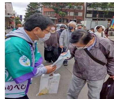
北海道新幹線利用促進PR(R5)