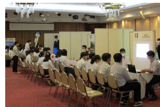
若年者向け合同企業説明会