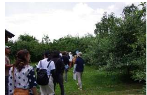
販売活動レベルアップ講座での先進地視察

今後の開催予定：11月中旬 開校式【第2期】 12月中旬 マーケティングを学ぶ 1月中旬 商品の適正価格について