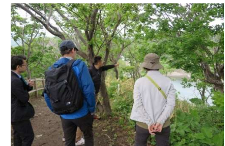
ATコンテンツ発掘相談会