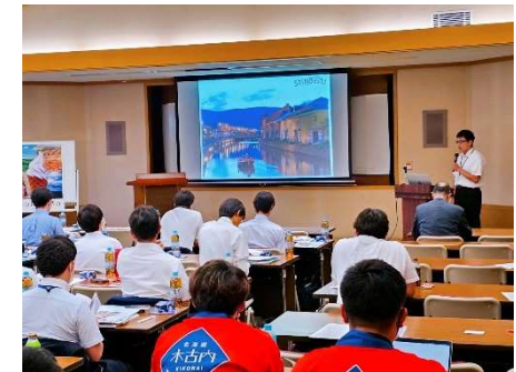
北海道教育旅行説明会・相談会