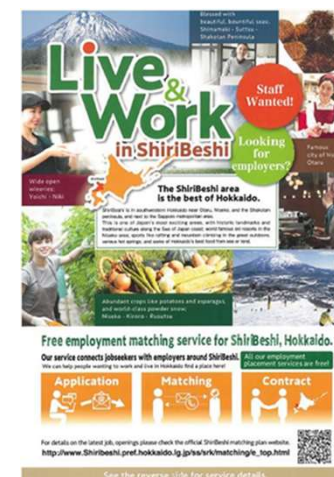
マッチングチラシ（英語版）