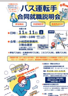
バス運転手就職説明会資料 (R5)

東北地方などで開催されるイベント等に参加し、後志の食や観光等の魅力を発信するなど、啓発活動を展開する。