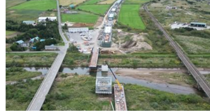
写真⑪ 栄原高架橋(長万部町)