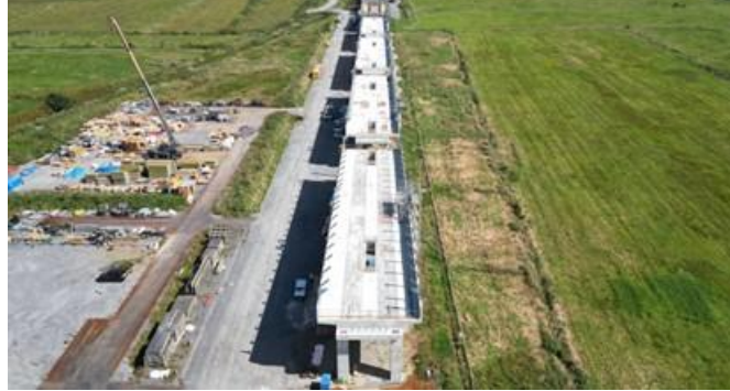
写真⑩ 静狩路盤(長万部町)