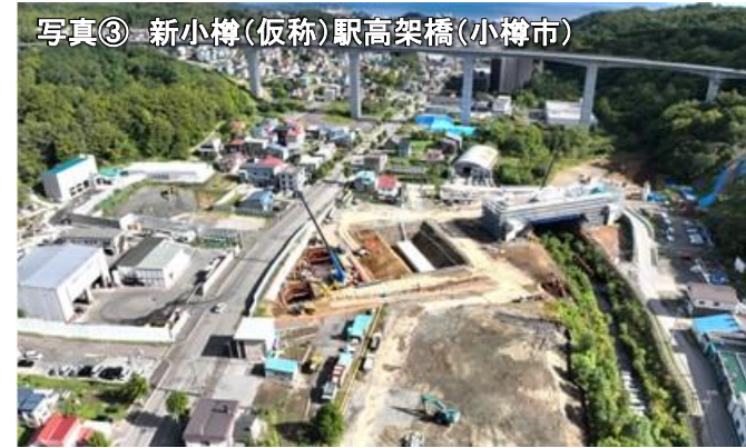
写真③ 新小樽(仮称)駅高架橋(小樽市)