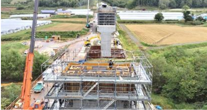
写真⑨ 宮田高架橋(宮田工区)(二七ㇿ町)