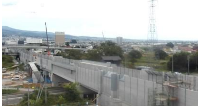
写真⑯ 市渡高架橋(北斗市)