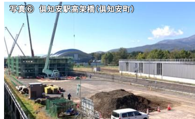
写真⑥ 倶知安駅高架橋(倶知安町)