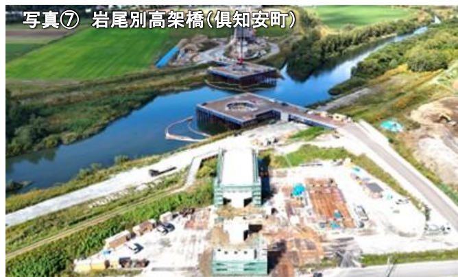
写真⑦ 岩尾別高架橋(倶知安町)