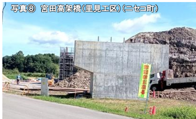
写真⑧ 宮田高架橋(里見工区)(ニセコ町)