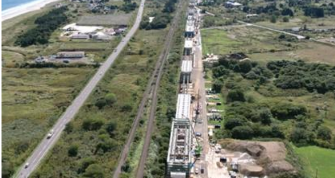
写真⑫ 平里高架橋(長万部町)