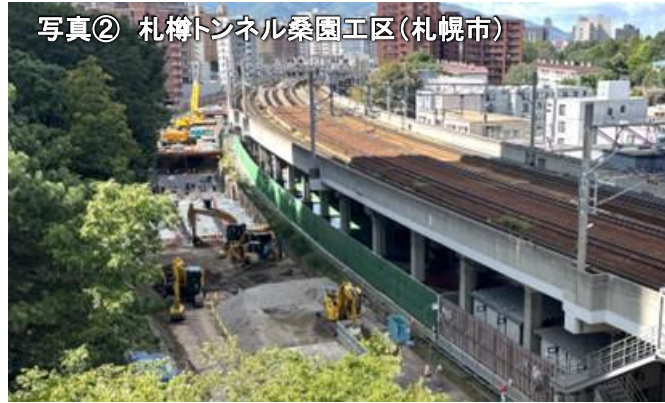
写真② 札幌トンネル桑園工区(札幌市)