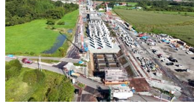
写真⑭ 新八雲(仮称)駅高架橋(八雲町)