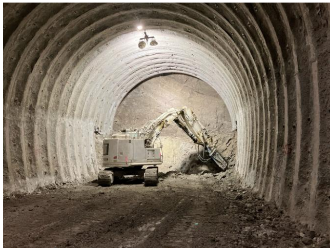
渡島トンネル(南鶉) トンネル掘削状況