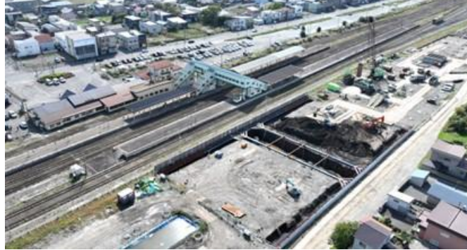
写真⑬ 長万部駅高架橋(長万部町)