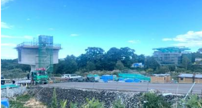
写真⑮ 大新高架橋(八雲町)