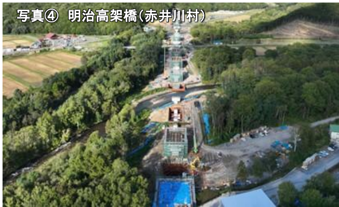
写真④ 明治高架橋(赤井川村)