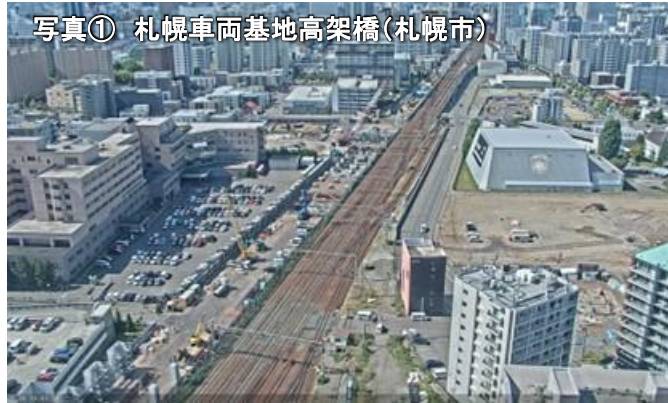
写真① 札幌車両基地高架橋(札幌市)