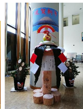
(1階道民ホールにて展示)