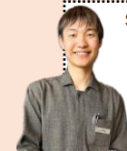
大学4年生 (北海道内から参加)

ShiriBeshi留学を経てワーキングホリデーへ。「語学を仕事にできる実感」が自信になりました！