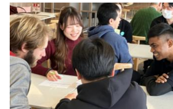
▲にほんごサロン「にこちゃん」で外国人の方と交流

外国からのお客様だけではなく、同僚やルームメイト、地域の方々等との交流を通じて、多様な人々が共に暮らす後志の「多文化共生の地域づくり」について学びましょう。