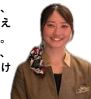
大学2年生 (東京都から参加)

フロントデスクで、お客様対応を主にしました。仕事はもちろん、プログラム中の研修も自分を見つめ直すよい機会になり、想像以上に自分を変えられました。ShiriBeshi留学は、新しい事を始めたいけれど勇気がない人こそチャレンジして欲しいと思います！