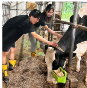
▲後志をより深く知る「地域エクスカージョン」