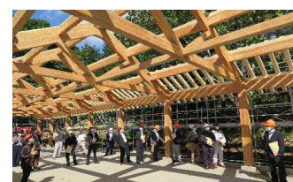
地域材利用施設見学(R2.9.29 ニセコ町)