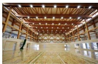
黒松内町総合体育館（黒松内町）