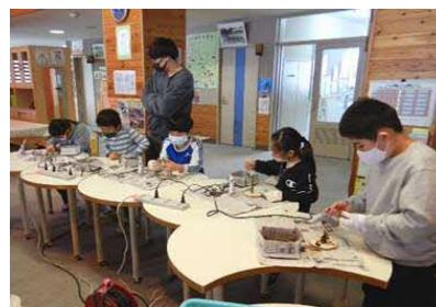
「登小学校森林学習」(R3.1.14 余市町)