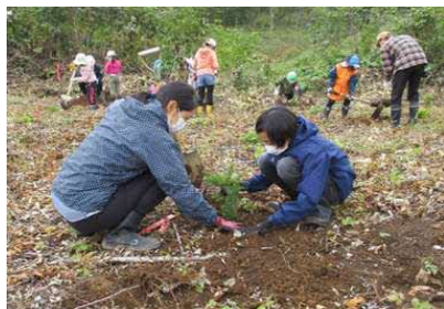
「コープ未来(あした)の森づくり」植樹祭(R2.10.4 京極町)