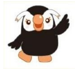
北方領土イメージキャラクター 「エリカちゃん」