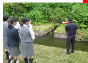
水路を流れる用水

双葉ダムは農業用のダムなので発電などは行っていませんが、実際に発電などを行っているダムもあります。