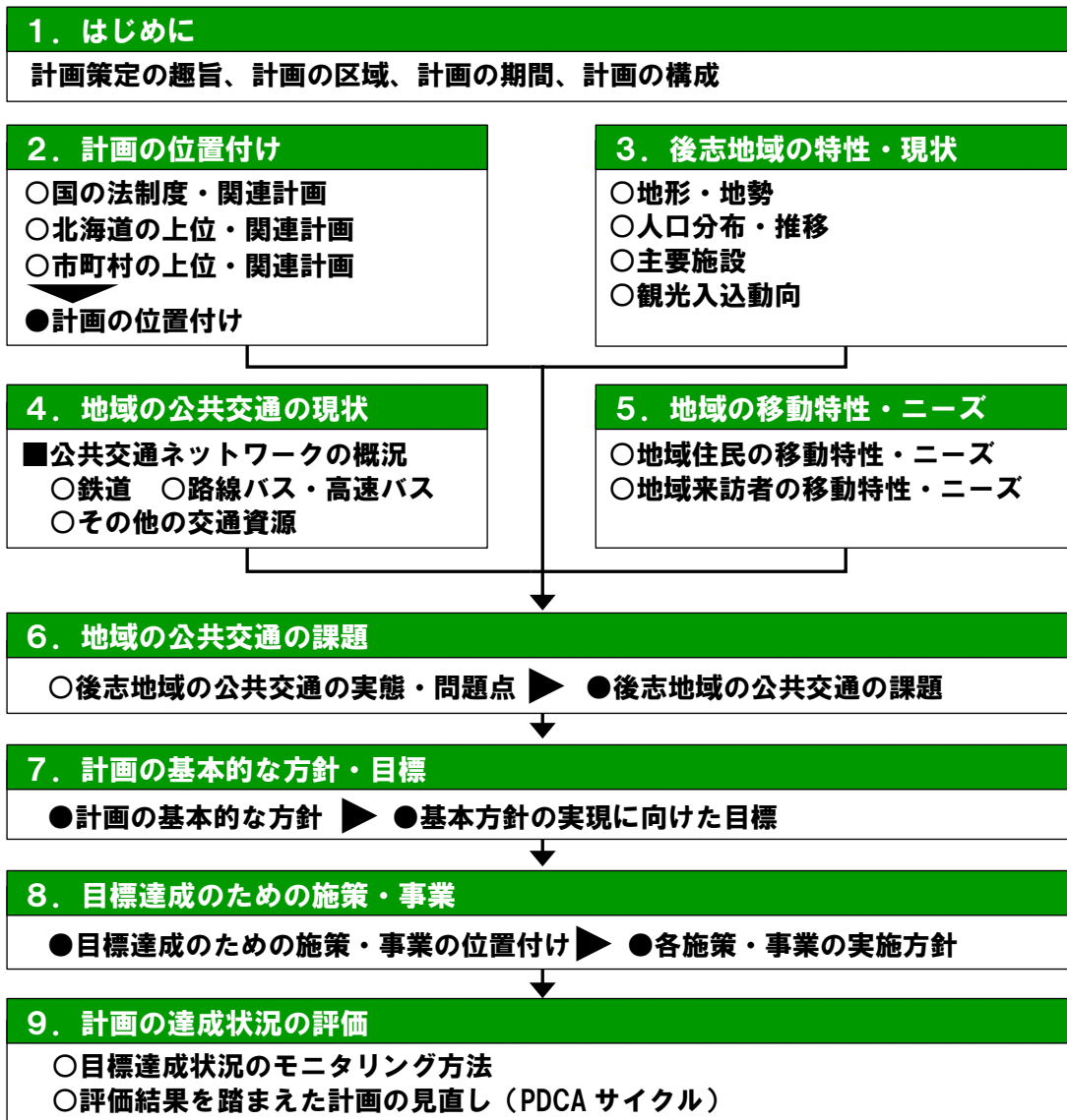
図 1-2 本計画の構成