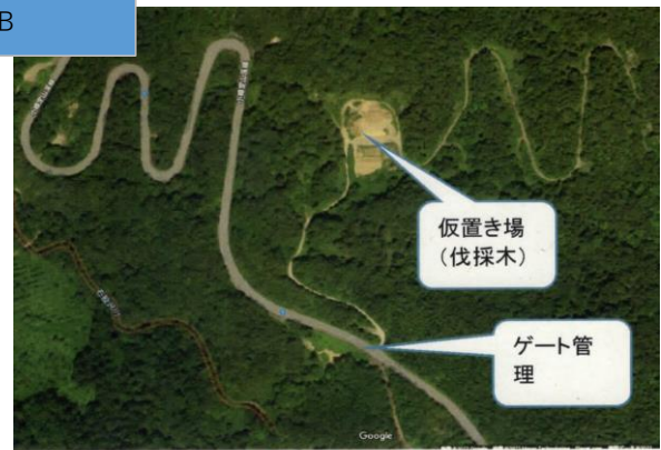
管理用道路(ゲートあり、施錠管理)