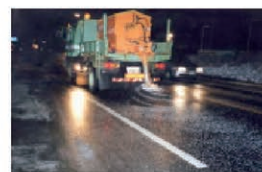
凍結防止剤散布状況