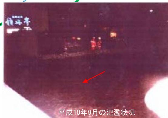
平成10年9月の氾濫状況