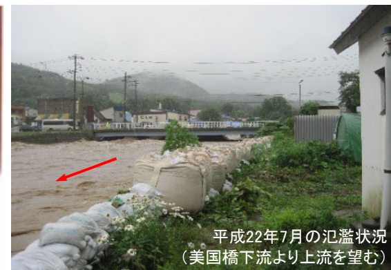
平成22年7月の氾濫状況 (美国橋下流より上流を望む)